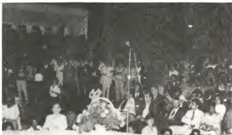
E anochi di manifestacion ariba dia 18 di Maart, dia di Himno y Bandera tabata un exito grandi. E organizacion tabata hopi bon y miles di personanan a asisti e anochi aki.

Dia 18 di maart 1981 a cuminsa cu un aubade di muchanan di school